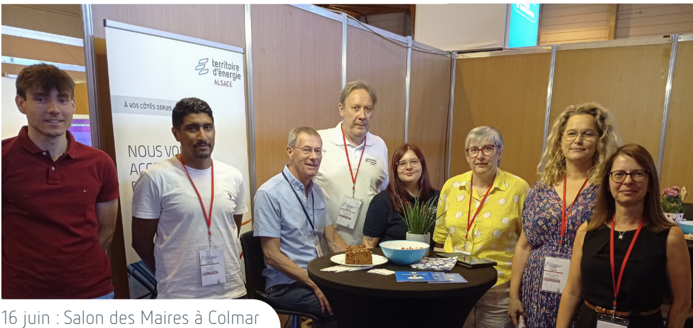
16 juin : Salon des Maires à Colmar