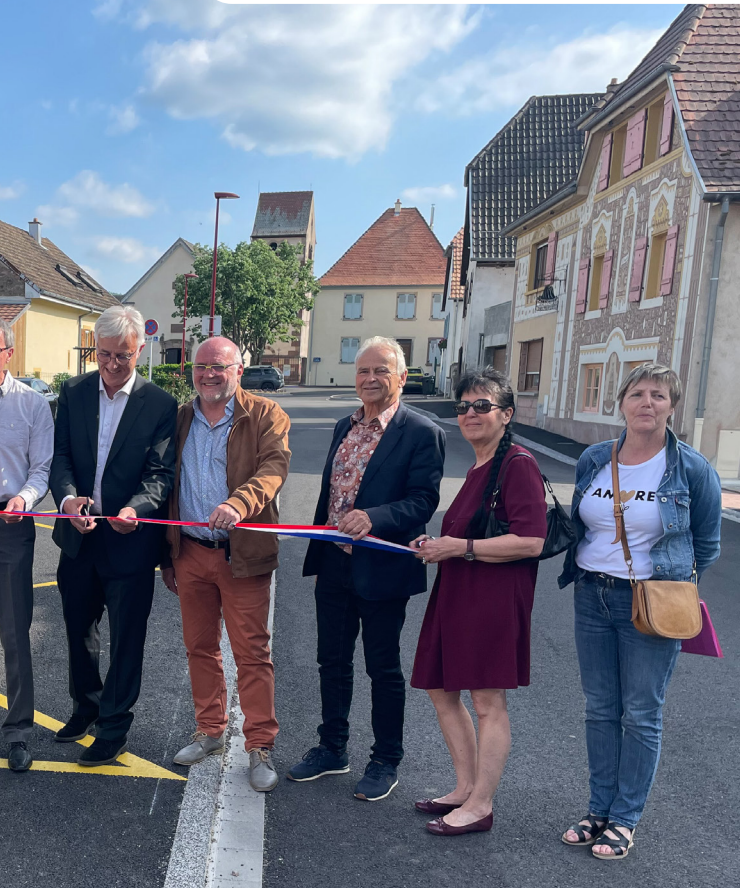
25 mai : Inauguration du chantier à Wintzfelden