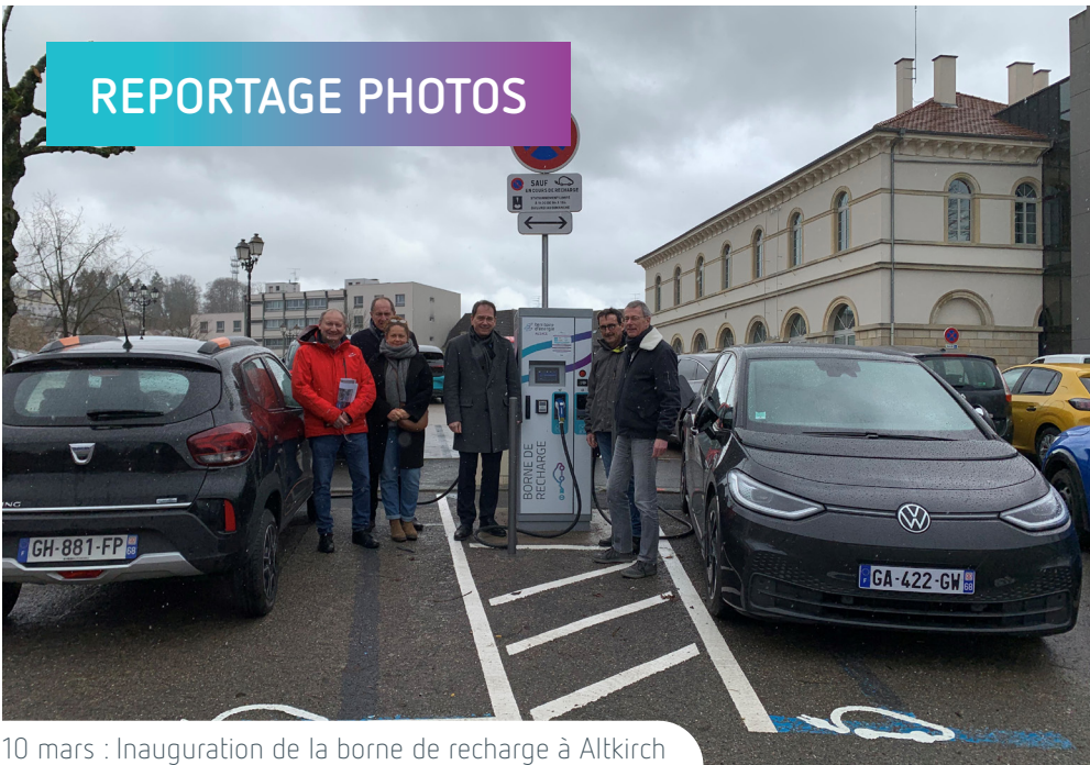
10 mars : Inauguration de la borne de recharge à Altkirch