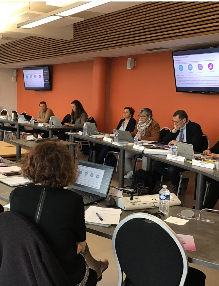
21 avril : Réunion du réseau des Directeurs à Besançon