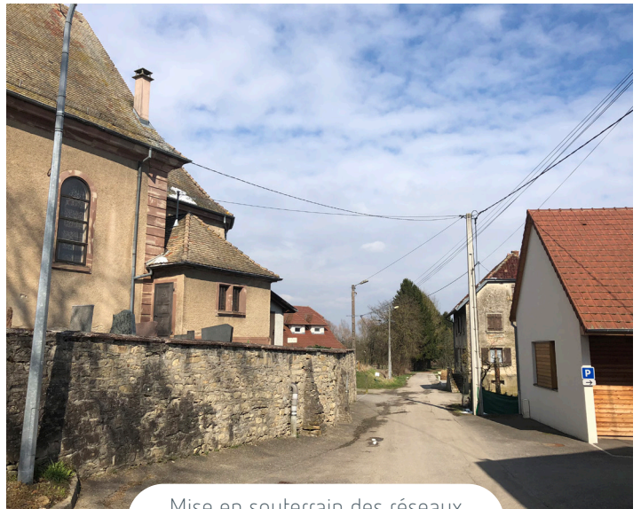
Mise en souterrain des réseaux secs à Eglingen : Avant / Après