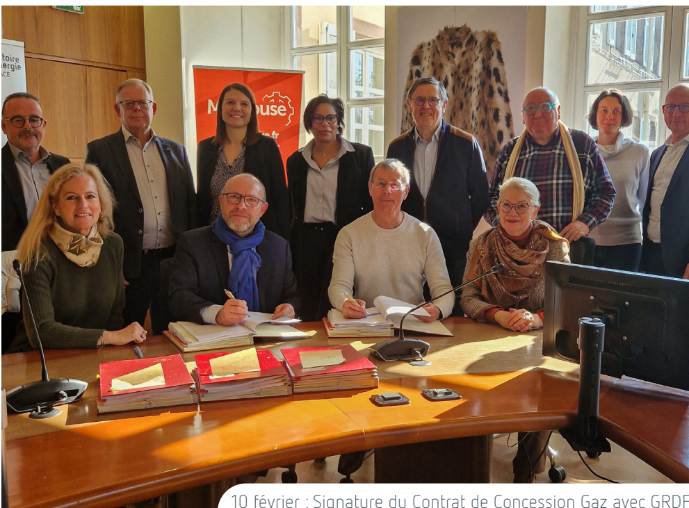
10 février : Signature du Contrat de Concession Gaz avec GRDF