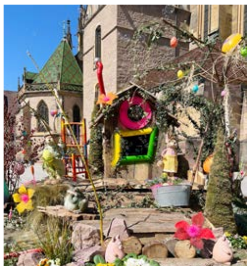
Les agents du Centre Technique Municipal ont concocté une décoration de Pâques féerique sur la Place Joffre.