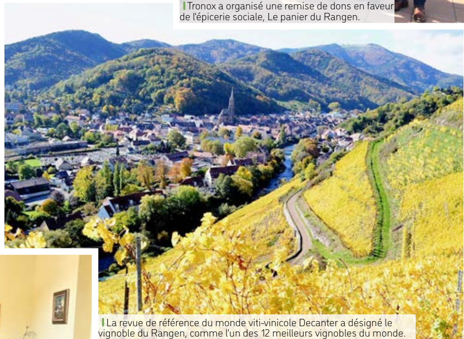
|| La revue de référence du monde viti-vinicole Decanter a désigné le vignoble du Rangen, comme l'un des 12 meilleurs vignobles du monde.