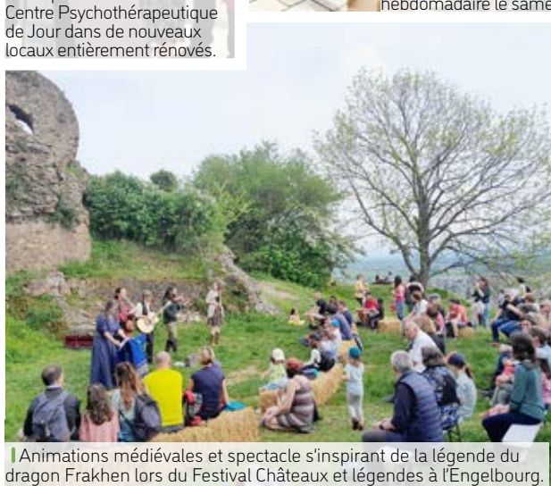
Animations médiévales et spectacle s'inspirant de la légende du dragon Frakhen lors du Festival Châteaux et légendes à l'Engelbourg.