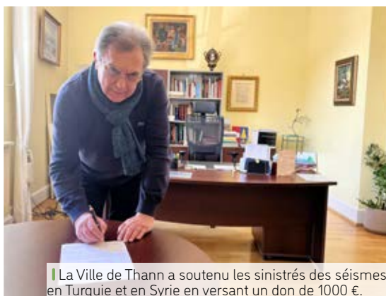
|| La Ville de Thann a soutenu les sinistrés des séismes en Turquie et en Syrie en versant un don de 1000 €.