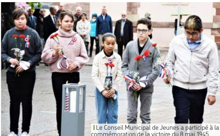
Le Conseil Municipal de Jeunes a participé à la commémoration de la victoire du 8 mai 1945.