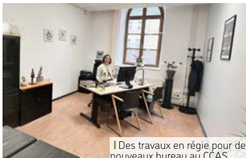
Des travaux en régie pour de nouveaux bureaux au CCAS.