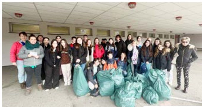
Opération Alsace Propre ramassage de déchets au quartier Schuman avec les élèves du collège Walch.