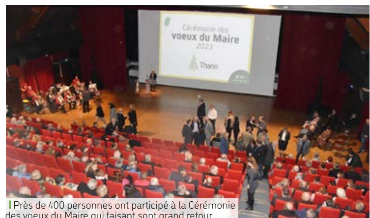
|| Près de 400 personnes ont participé à la Cérémonie des vœux du Maire qui faisant sont grand retour.