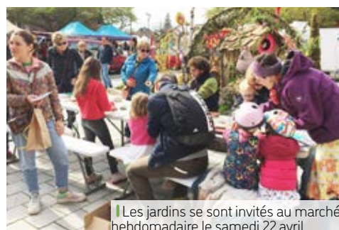
Les jardins se sont invités au marché hebdomadaire le samedi 22 avril.