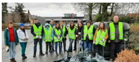
L'association Le soleil du Rangen a organisé une opération de ramassage de déchets avec le soutien de la Ville de Thann sur le parking du magasin Match.