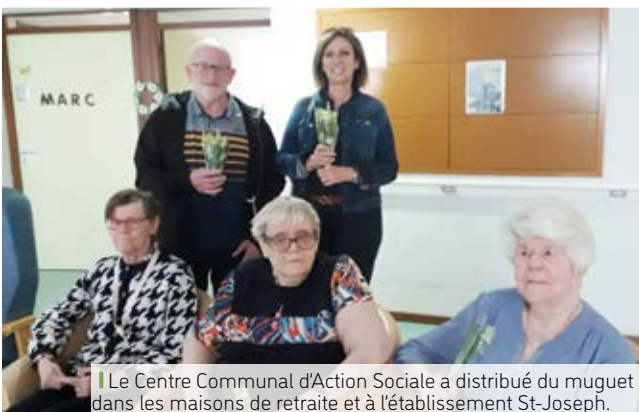
Le Centre Communal d'Action Sociale a distribué du muguet dans les maisons de retraite et à l'établissement St-Joseph.