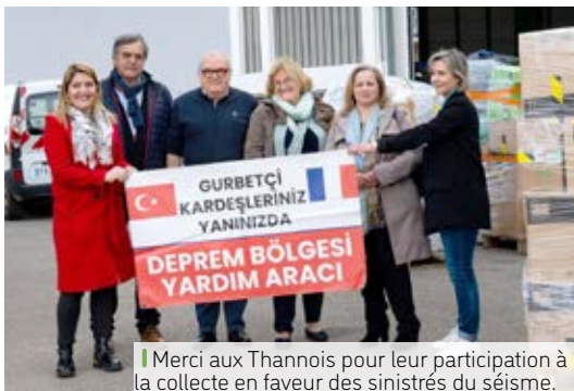
|| Merci aux Thannois pour leur participation à la collecte en faveur des sinistrés du séisme.