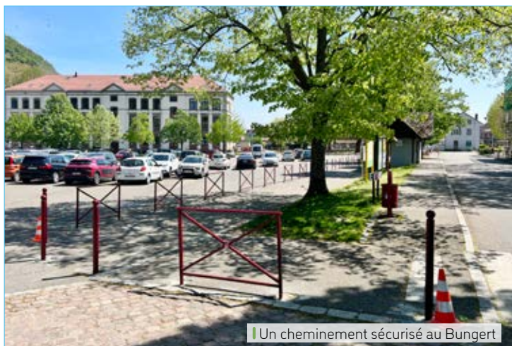
Un cheminement sécurisé au Bungert