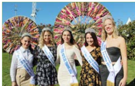
Tableau des animations disponible sur www.ville-thann.fr

(Centre Sportif Fernand Bourger – service des sports – rue de la paix à Thann)