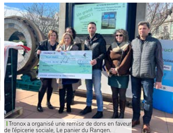
|| Tronox a organisé une remise de dons en faveur de l'épicerie sociale, Le panier du Rangen.